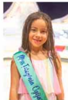
NERMI E. B. MISS FOTOGENIA