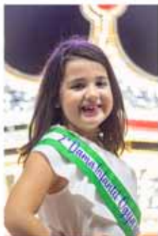
ALEGRIA G. P. 2ª DAMA