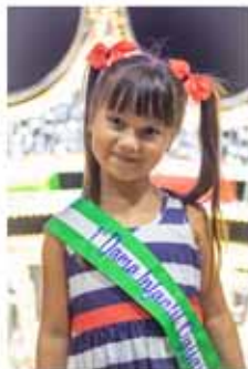
AMAIA I. N. 1ª DAMA